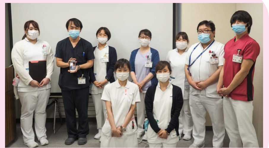
排尿ケアチームのみなさん